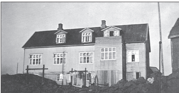
Húsin á Krákusteini

verður greitt frá versoni Sámal, sum var millum teir fyrstu, sum fingi bil í Føroyum, og sum doyði av eini sprengivanlukku á nýggja hospitalinum í 1924